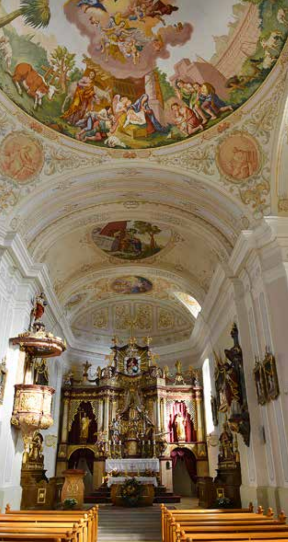
Wallfahrtskirche Maria Schutz abeim Bründl